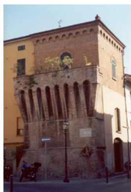
Osteria del Piolo